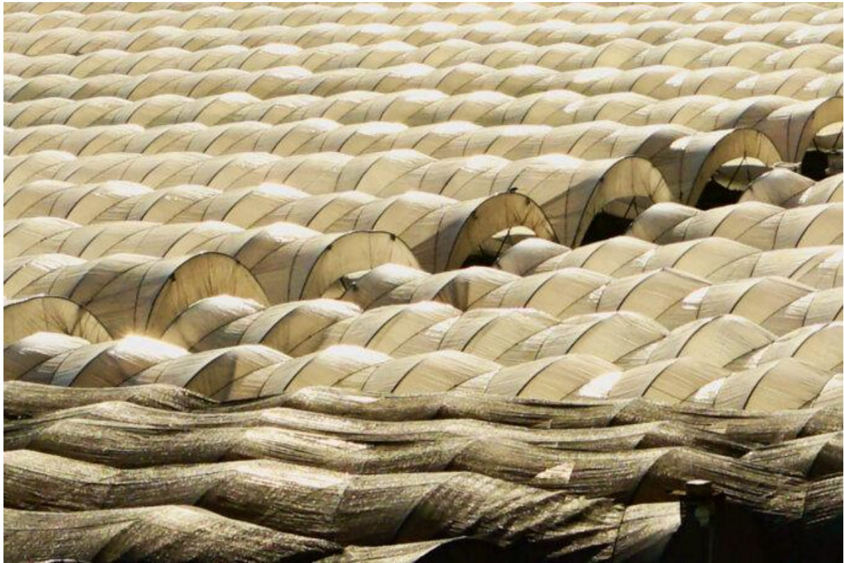
Champs de fraises à perte de vue dans la région de Huelva (Espagne, mai 2023).

Devant le logement de San Juan del Puerto, elle a découvert le portail cadenassé, une entrave à la liberté de circuler des ouvrières. Elle l'a dénoncée sur les réseaux sociaux. Et dans la presse, auprès du journaliste indépendant Perico Echevarria notamment, poil à gratter avec sa revue Mar de Onuba , seul média local à déranger un système agroalimentaire et migratoire qui broie des milliers de vies. Surexport a fini par faire sauter le verrou.