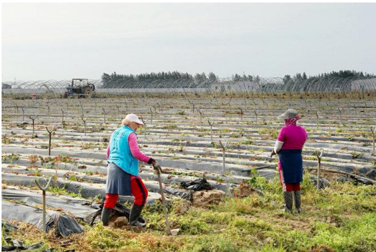
Des ouvrières marocaines s'affairent dans un champ de fraises où les serres ont été démontées, la saison se terminant (région de Huelva, Espagne, mai 2023).