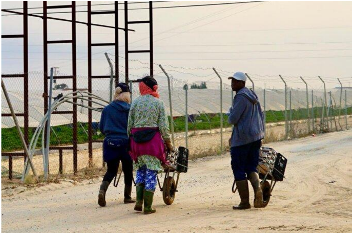
Des ouvrières agricoles dans une exploitation intensive de fraises (région de Huelva, Espagne, mai 2023).