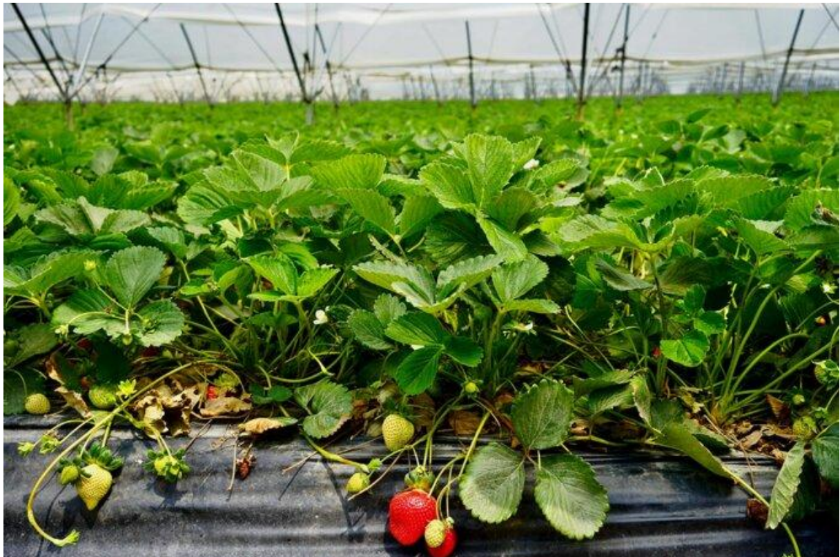
Un champ de fraises dans la région de Huelva (Espagne, mai 2023).

Elles étaient une trentaine d'ouvrières marocaines, en route pour la « finca », la ferme où elles cueillent sans relâche, à la main, les fraises du géant espagnol Surexport, l'un des premiers producteurs et exportateurs européens, détenu par le fonds d'investissement Alantra. Le chauffeur roulait vite, au-dessus de la limite autorisée, dans un épais brouillard. Il a été blessé légèrement.