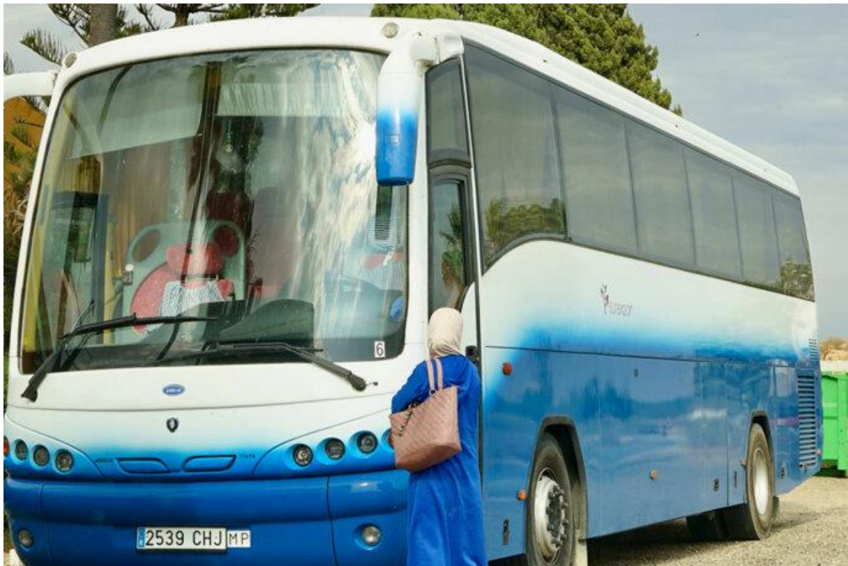
Une ouvrière agricole marocaine attend le bus de la société Surexport qui les conduit de leur logement à l'exploitation de fraises (région de Huelva, Espagne, mai 2023).

retenue sur leur salaire, par l'entreprise Surexport, qui n'a pas répondu à nos sollicitations. Privées d'intimité, elles se partagent les chambres à plusieurs. La majorité des femmes accidentées est de retour, à l'exception des cas les plus graves, toujours hospitalisés.