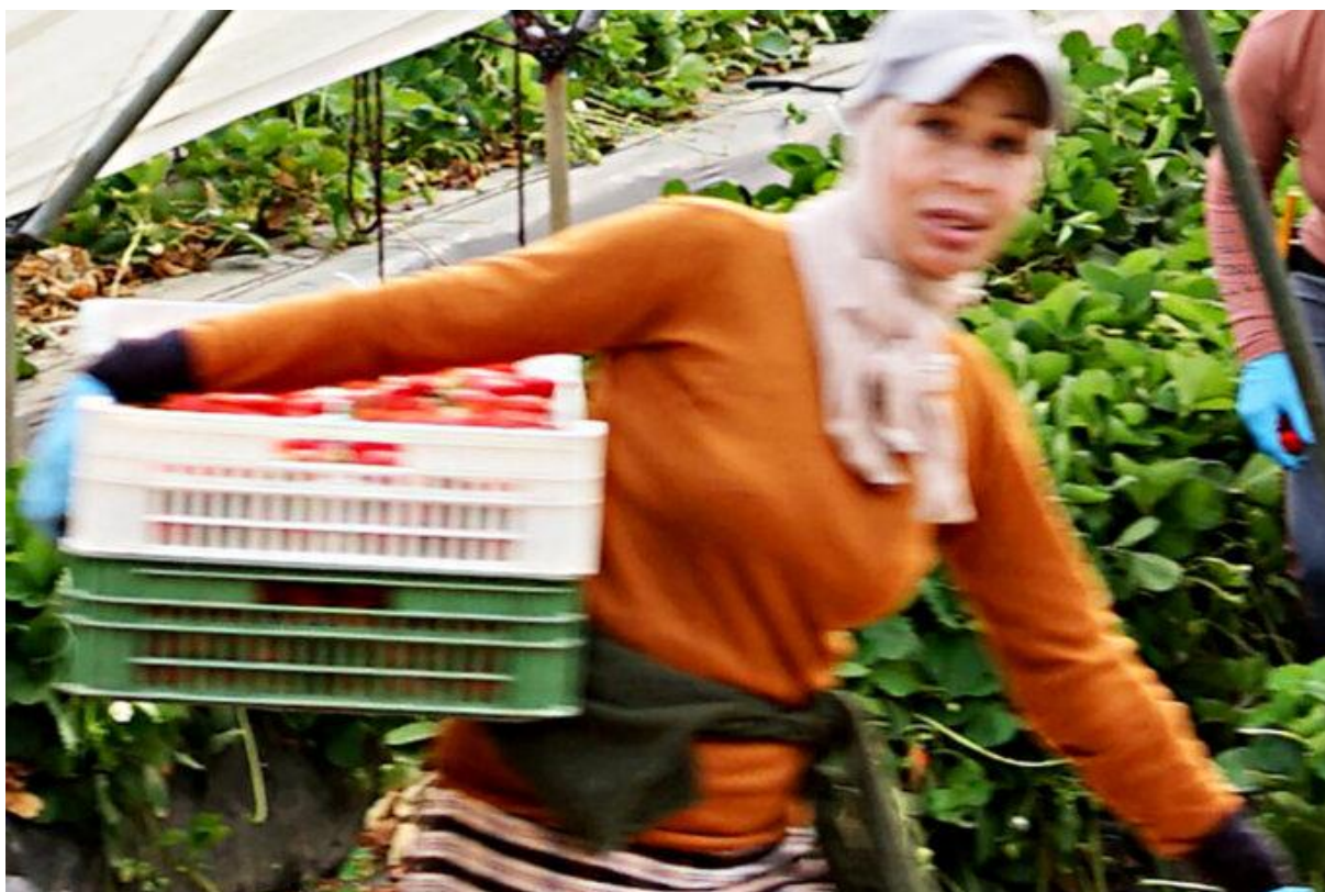
La cueillette des fraises est aujourd'hui majoritairement assurée par des ouvrières marocaines (région de Huelva, Espagne, mai 2023).

Et un certain statut social : « On nous regarde différemment quand on revient. Moi, je ne suis plus la divorcée au ban de la société, associée à la prostituée. Je suis capable de ramener de l'argent comme les hommes, même beaucoup plus qu'eux », assure fièrement Aïcha.