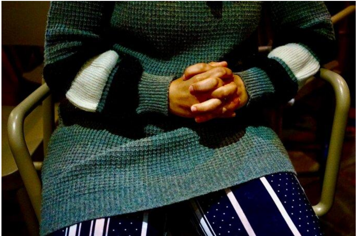
Une des ouvrières blessées dans l'accident de bus (région de Huelva, Espagne, mai 2023).

Huelva, qui prévoit environ 40 euros brut par jour pour 6 h 30 de travail, avec une journée de repos hebdomadaire. Sans être payées plus.