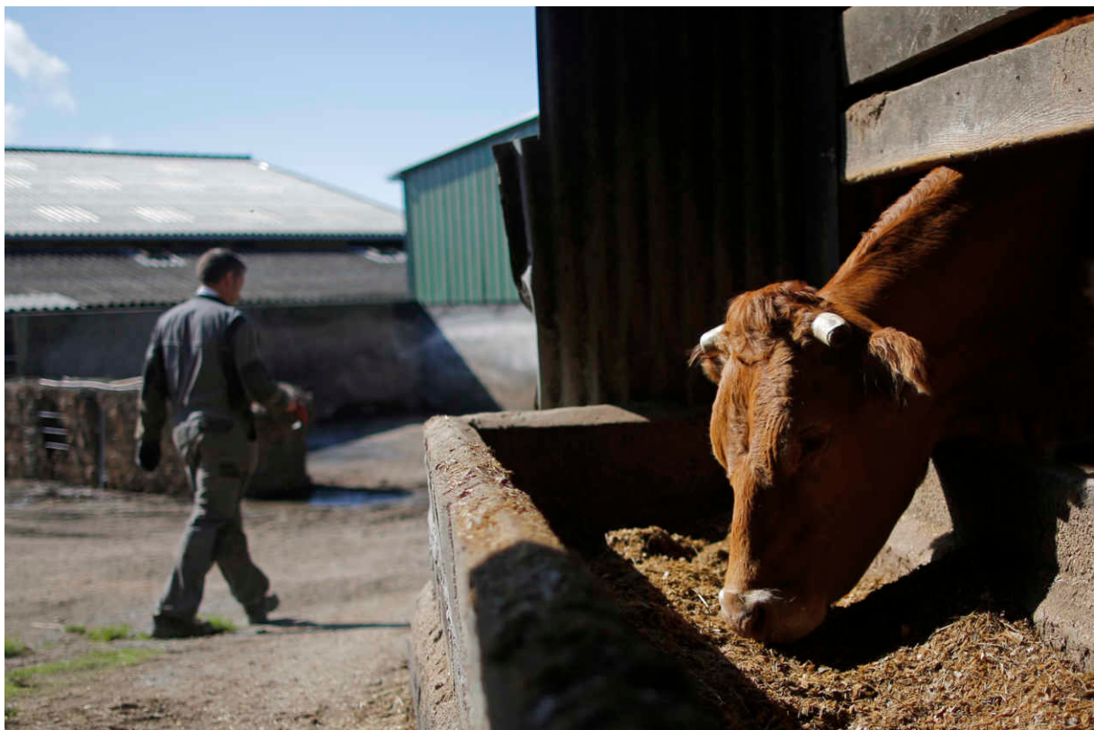
A La Chapelle-Caro (Morbihan), dans le centre de la Bretagne, le 2 septembre 2015.

Le naufrage du fleuron avicole Doux , créé en 1955 à Châteaulin (Finistère), est l'exemple le plus marquant. Ex-première exportatrice européenne de volailles, l'entreprise a subi une série de déconvenues, dont l'arrêt de certaines subventions et la perte de marchés arabes au profit de volaillers étrangers toujours plus compétitifs. En quelques années, la société, qui embauchait plus de 3 400 salariés et faisait vivre quelque 800 éleveurs, s'est effondrée.